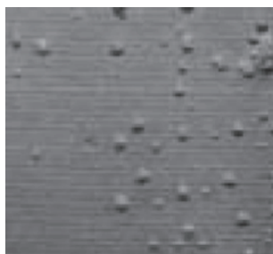
ブリストアの写真

みなさま『ブリストア』という言葉はご存知でしょうか。塗装業界では頻繁に使用される用語で、皮膜がその内部に含まれる液体やガス、錆等により、プクッと膨れしてしまう現象の事をさします。(左写真ご参照)