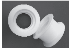
切削加工品例 「ヘルール式段付きブッシング」

一品一様でご希望の品を製作する事の多い私たちが、一番身近に取扱う加工技術が【切削加工】です。丸棒や板材などの素材、時にはパイプやブロック、既製の成型品を使用して、切ったり削ったりして形を作り出します。