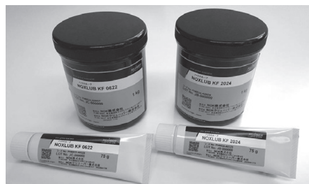
※価格やSDS等の詳細は営業までお問合せください。

https://at.flon.co.jp/products/detail/1584