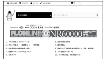
アットフロン (トップページ)

「アットフロン」とは、フロンケミカルが運営する販売サイトです。弊社カタログ掲載品のすべてを取り扱っております。また、アットフロンにのみ限定掲載している商品も一部ございます。『商品検索～御見積～注文』まで、一貫して行える便利なサイトです。もともとはB to C向けのサイトでしたが、現在は改良を行い、「 普段お取引のある企業様(B to B向け)としても ご利用いただけるようになっております。